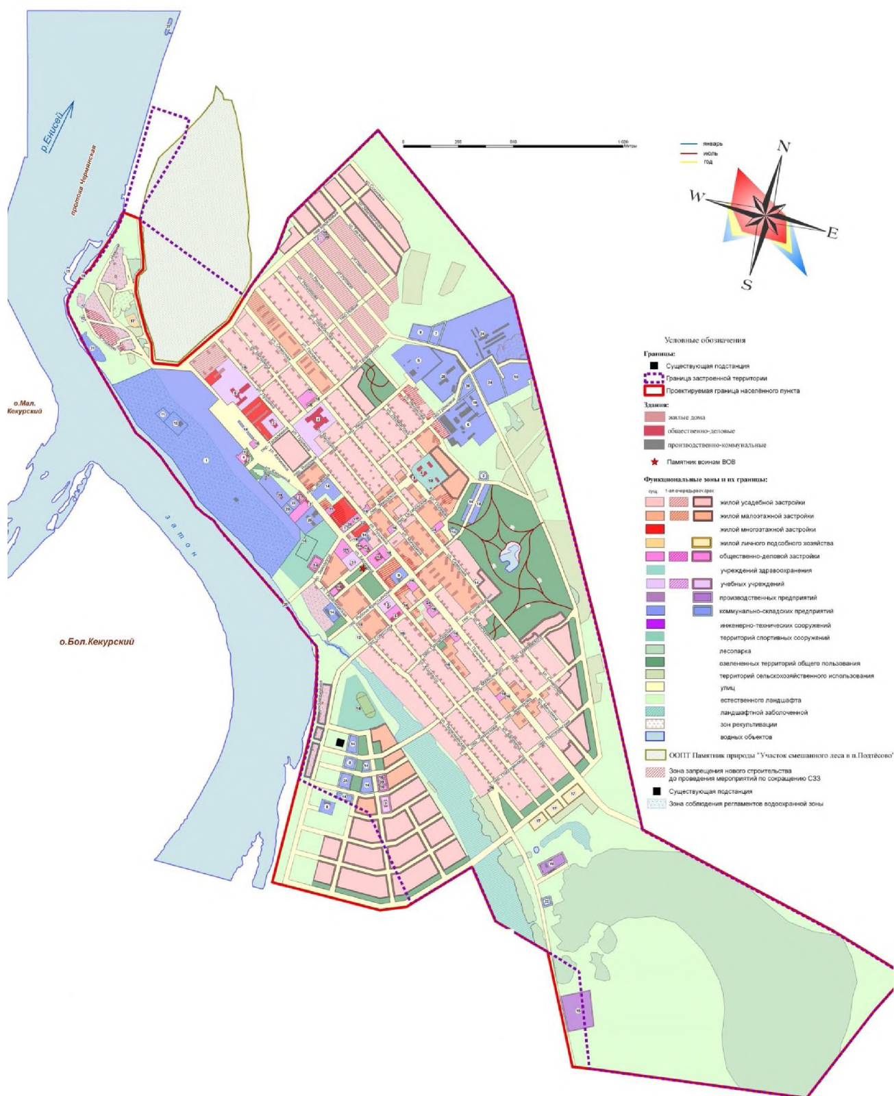
Рисунок 1.1 Схема функционального зонирования территории п. Подтесово